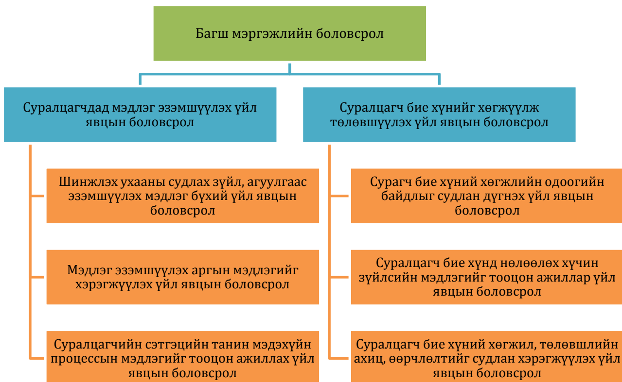
Зураг 1. Багшийн сурган хүмүүжүүлэх сэтгэл судлалын боловсрол (Жамц Л, 2016)

XXI зууны хөгжил дэвшил, мэдээлэл харилцааны эринд багш мэргэжлийн онцлог, багш- олон нийттэй ажиллах арга зүйд анхаарах шаардлага тулгарч байна. Боловсрол судлалын салбарт багшийн хөгжил, багш мэргэжлийн онцлог зэргээр олон чиглэлийн судалгааны бүтээлүүдээс Л.Жамц судлаачийн тодорхойлсон “багшийн сурган хүмүүжүүлэх сэтгэл судлалын боловсролын загвар”- ыг бүрэн дунд боловсролын газарзүйн сургалтын хөтөлбөрийн зорилгыг багшийн мэргэжлийн боловсролын загвартай уялдуулан авч үзэж болохоор байна (Зураг 1).